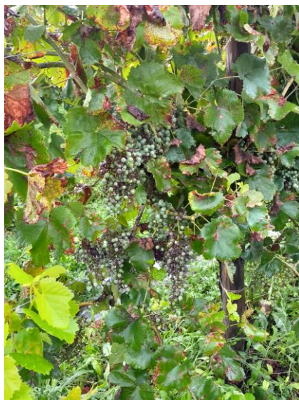
Peronospora su vigneto test non trattato (Scuola Enologica)

A tal proposito, si evidenzia che per coloro che sono in certificazione SQNPI e che volessero intervenire dopo una grandinata con il Folpet o simili (per disinfettare e cicatrizzare il grappolo), oltre ai due interventi (6+2) dati in deroga dalla Regione Veneto in questa annata, c'è la possibilità di un ulteriore trattamento con tali prodotti, ma attenzione, esclusivamente per le aziende viticole che si trovano all'interno dei Comuni colpiti da questa calamità. Nel corso dei controlli (registro dei trattamenti, ecc.) da parte degli Organismi preposti, sarà verificata anche l'attendibilità per questo eventuale ulteriore intervento. Si ricorda ovviamente di rispettare prioritariamente l'etichetta dei prodotti utilizzati, in particolare nel numero degli interventi ammessi e del periodo di carenza!