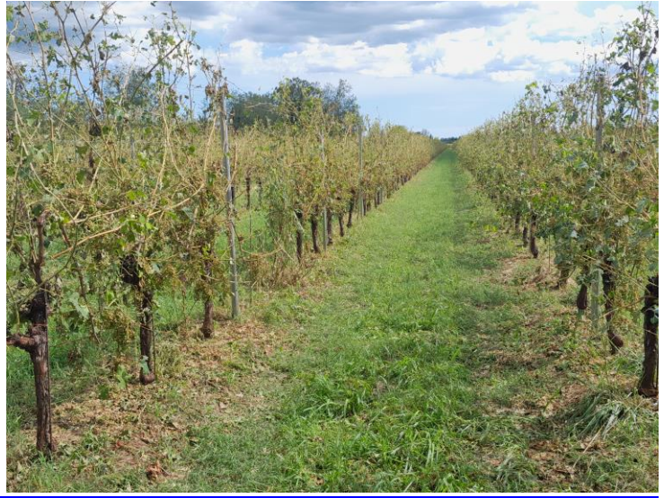
Grandinata del 25 luglio sera a Scomigo di Conegliano